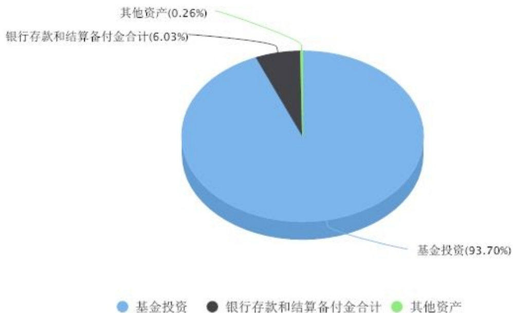
投资组合资产配置图表 数据截止日期:2025年12月31日